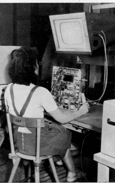
Prüfung der Kippteile